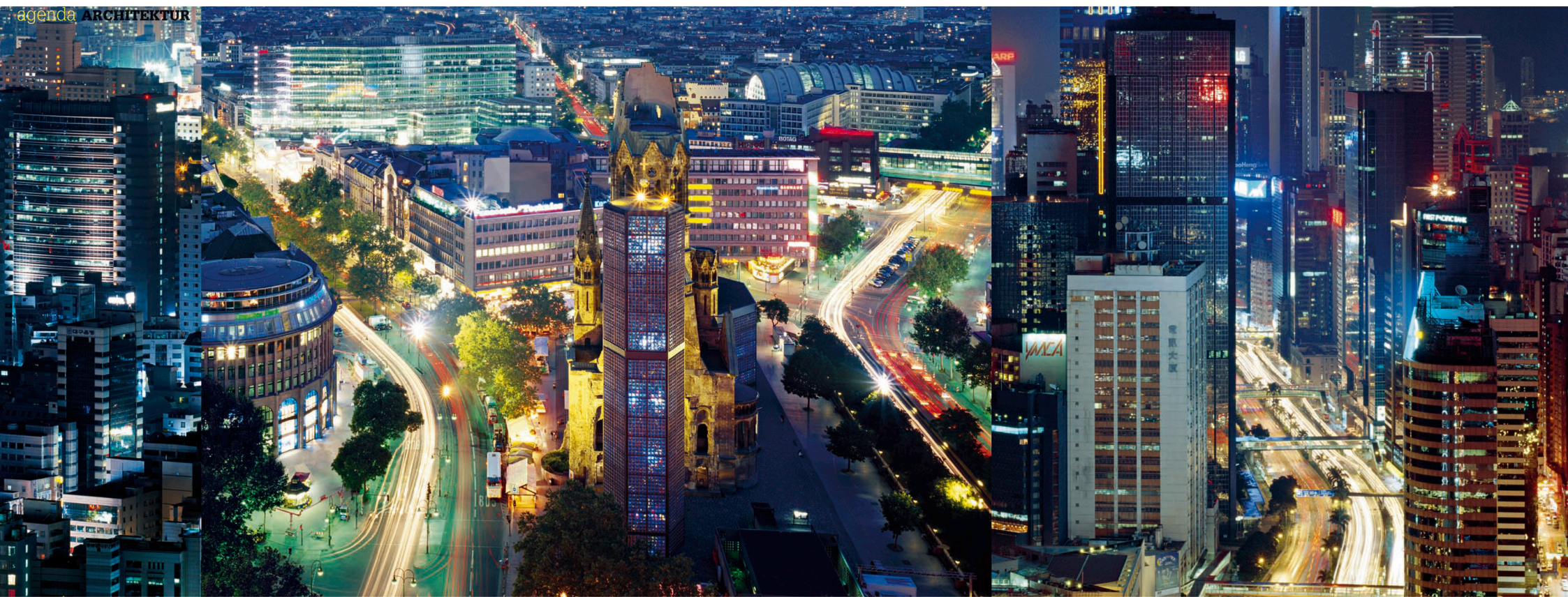
Visuell ganz stark: Die Aufnahmen von Metropolen von Tokio bis Abu Dhabi wurden zu einem Fries zusammengesetzt.